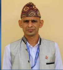
यज्ञमुर्ति न्यौपाने सल्लाहकार